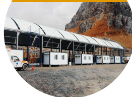
Adecuación de Contenedores